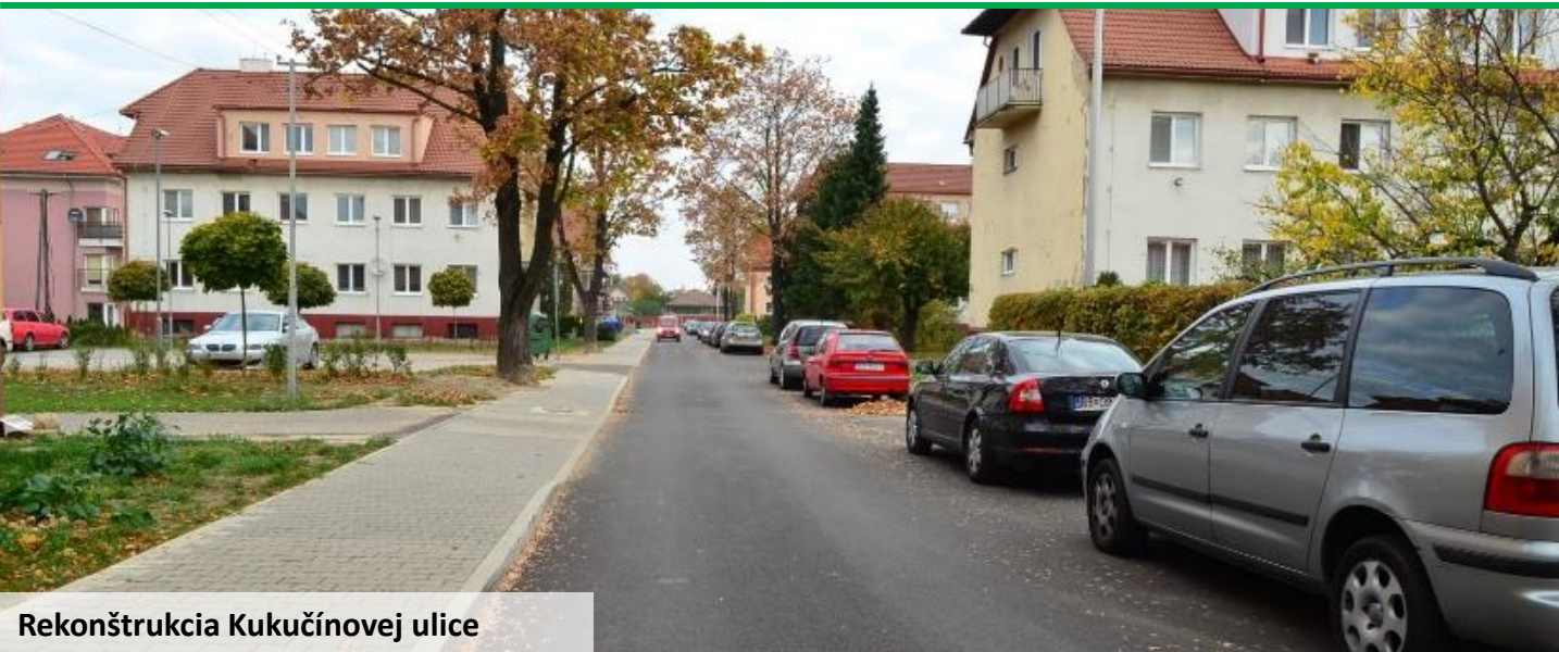
Rekonštrukcia Kukučínovej ulice