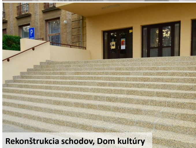
Rekonštrukcia schodov, Dom kultúry