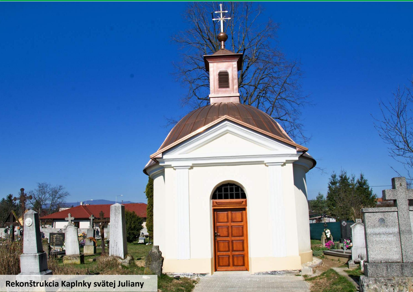
Rekonštrukcia Kaplnky svätej Juliany