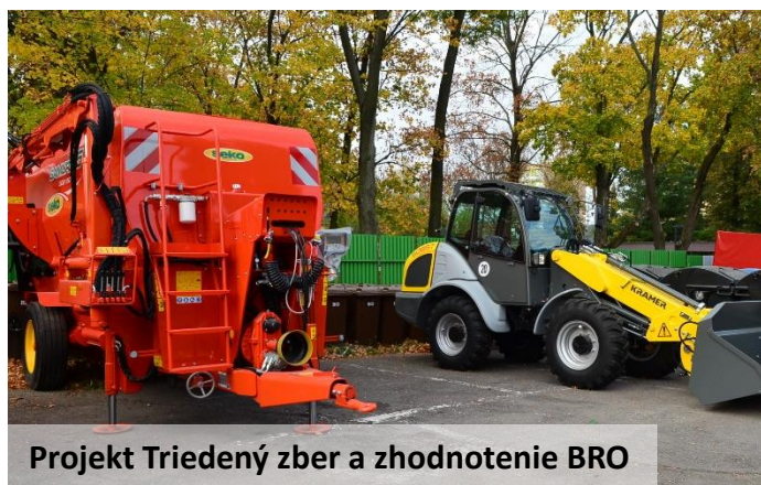
Projekt Triedený zber a zhodnotenie BRO