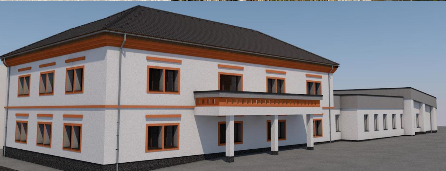
Vizualizácia rekonštrukcie Mestského úradu