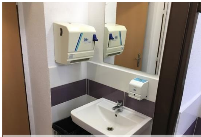
Rekonštrukcia sociálnych zariadení, Dom kultúry

realizovaná bola výmena lustrov, rekonštrukcia dámskych a pánskych toaliet vrátane kanalizácie, ozvučenie sály, rekonštrukcia schodov do budovy a iné.