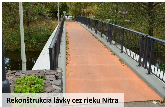
Rekonštrukcia lávky cez rieku Nitra

Záverom by som chcel zhrnúť, že počas 4-ročného obdobia sme preinvestovali 3,9 milióna €, z toho sa nám podarilo získať 2,4 milióna € z externých zdrojov z dotácií.