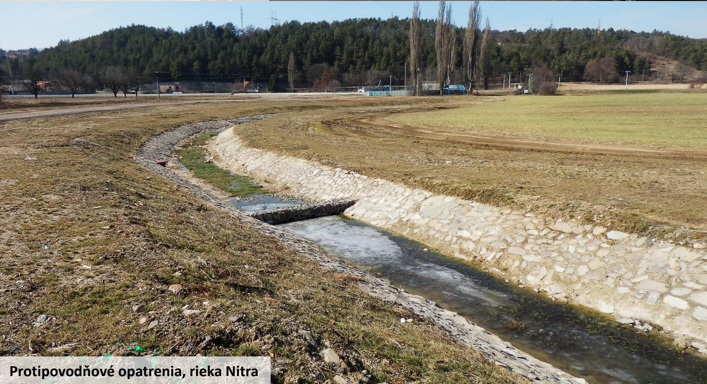
Protipovodňové opatrenia, rieka Nitra