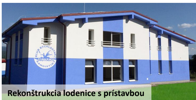
Rekonštrukcia lodenice s prístavbou

Teší ma veľký záujem mladých futbalistov, členov klubu kick-box, malých gymnastiek v CVČ. Aj keď jedna z pých nášho mesta – vodné pólo dočasne stratilo vlastný „stánok“, nové vedenie Národného centra vodného póla má svoju plnú podporu.